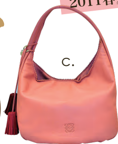
c. LOEWE ロエベ