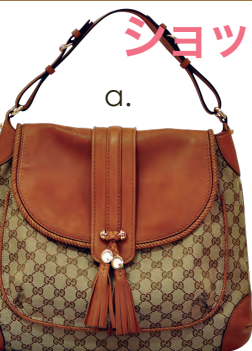
a. GUCCI グッチ