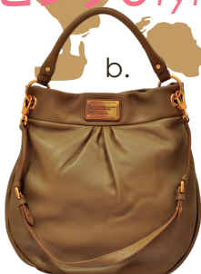
b. Marc by Marc Jacobs マークバイマークジェイコブス