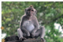
▲モンキーフォレスト