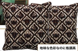
地味な色彩なのに格調高く洗練された風合いが魅力的なバティック柄クッションカバー