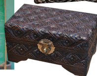
お気に入りのアクセサリやジュエリーを収納し、たくなる可愛い木彫りのボックス