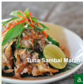
Tuna Sambal Matah

世界のセブも訪れるエステート。ゆっくり滞在出来る方は栄養士、自然療法士、ヨガ・ピラティスのインストラクターなどで構成されたウェルネスプログラムを是非体験して。