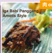
Iga Babi Panggang Ametis Style