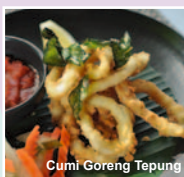
Cumi Goreng Tepung