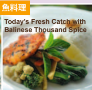
Today's Fresh Catch with Balinese Spices